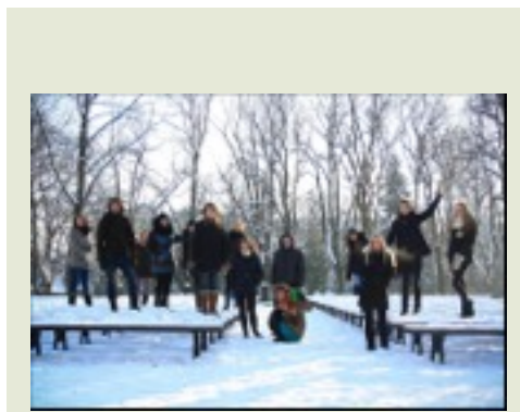
JVR skolas nodarbība kopā ar lektoriem - fotogrāfiem 2013. gada janvārī.

Programmā jaunieši savus vides un žurnālistikas projektus var veidot par visdažādākajiem tematiem, kas arī tiek izmantots: Baltijas jūras piesārņojums, mežu izciršana, atkritumu apsaimniekošana, ilgtspējīgs patēriņš u.c. Kopš 2012. gada rudens Jaunie vides reportieri var darboties neformāla rakstura JVR skolā, kas norisinās reizi mēnesī Rīgā. Tā sniedz iespēju